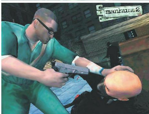
Spiel-Charakter Daniel Lamb bahnt sich einen Weg in die Freiheit.